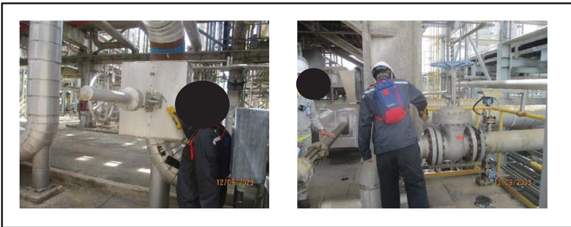
รูปที่ 1 ตัวอย่างอุปกรณ์และการตรวจวัดการรั่วซึมจากอุปกรณ์ในโรงงานที่เป็นแหล่งกำเนิดชนิดฟุ้งกระจาย